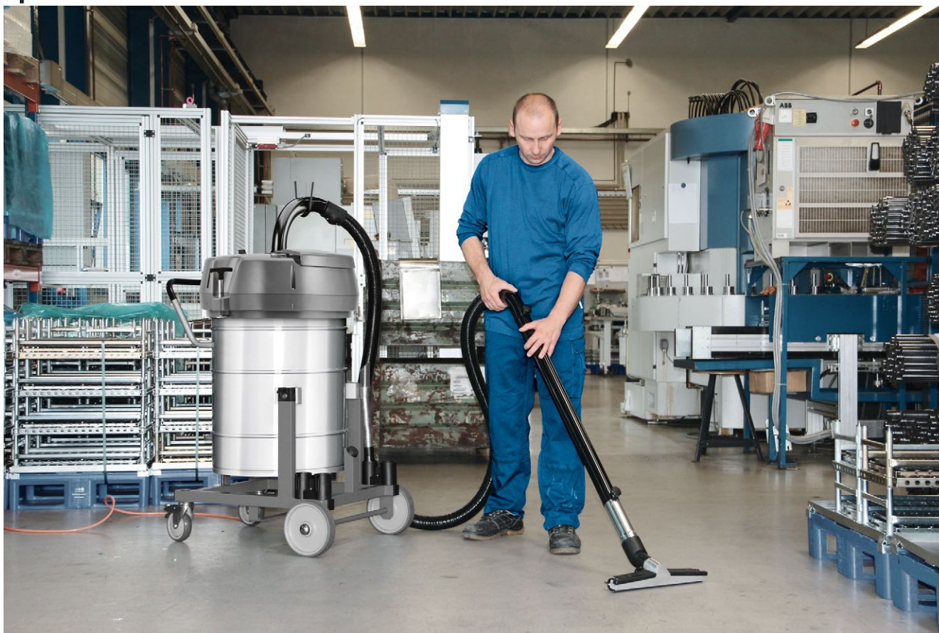
IVR-L 100/24-2 Tc Me